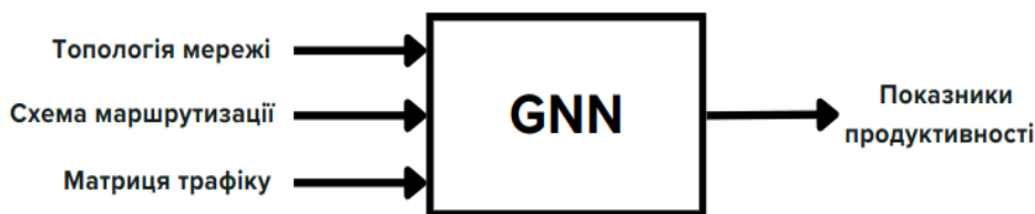
Рис. 1. Загальна схема оригінальної моделі RouteNet

де: h_t – прихований стан в момент часу t , x_t – вхід на t -му кроці, W_x і W_h – матриці ваг.